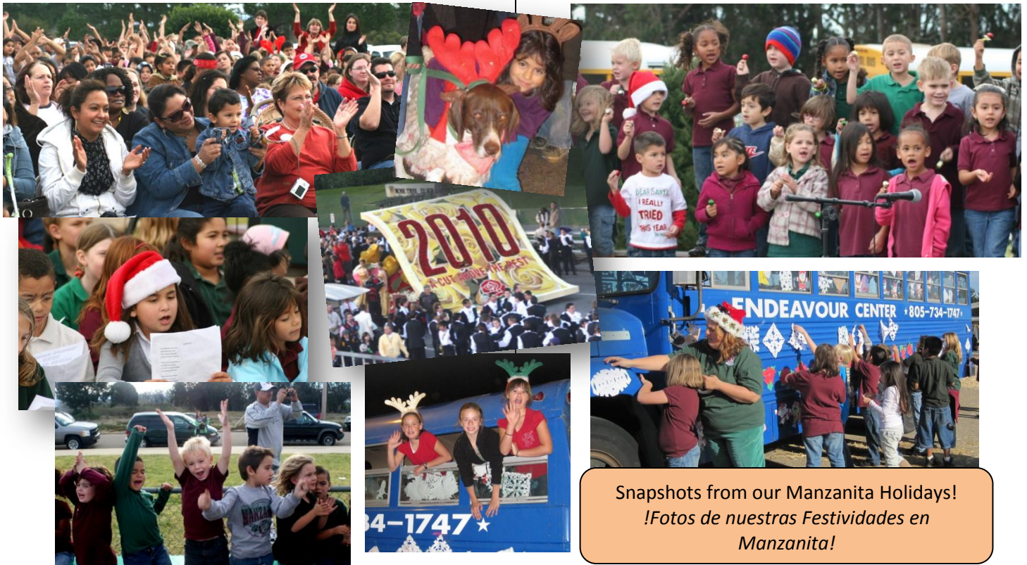
Snapshots from our Manzanita Holidays! !Fotos de nuestras Festividades en Manzanita!

El Comité del Anuario del 2010 está compuesto de alumnos y del personal