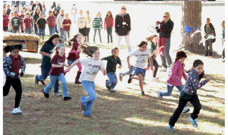
Turkey Trot and PTA Star Party! Carrera de pavo y fiesta de estrellas