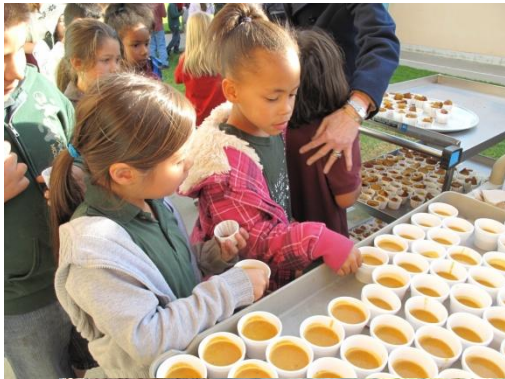
Soup Day! Día de sopade calabaza